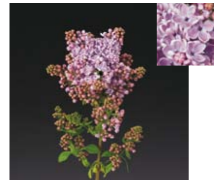
SYRINGA 'HUGO KOSTER'