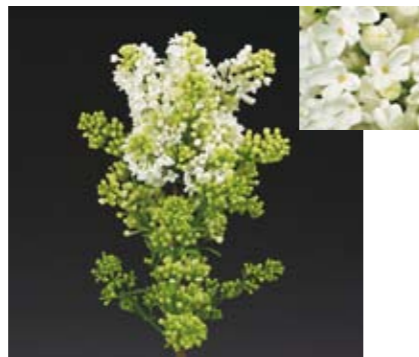
SYRINGA 'ENGLER WEISSEN TRAUM'