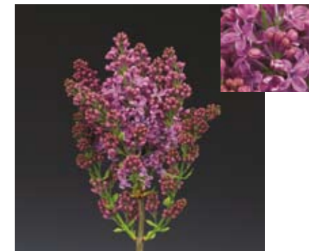
SYRINGA 'RUHM VON HORSTENSTEIN'