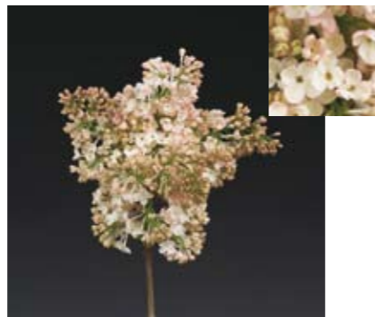
SYRINGA 'MAIDEN'S BLUSH'