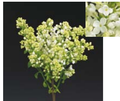
SYRINGA 'MADAME FLORENT STEPMAN'