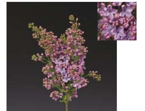
SYRINGA 'HERMAN EILERS'