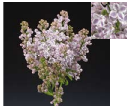
SYRINGA 'LILA WONDER'