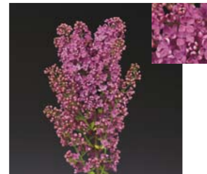
SYRINGA 'ANDENKEN AN LUDWIG SPÄTH'