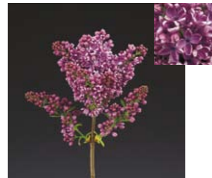
SYRINGA 'DARK KOSTER'