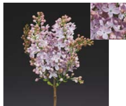
SYRINGA 'MARÉCHAL FOCH'