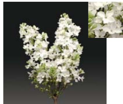
SYRINGA 'WHITE SIRE'