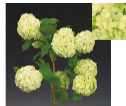
VIBURNUM OPULUS 'ROSEUM'